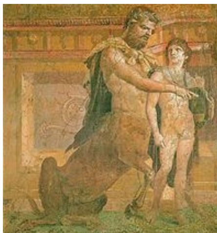
Chiron lehrt den jungen Achilleus.