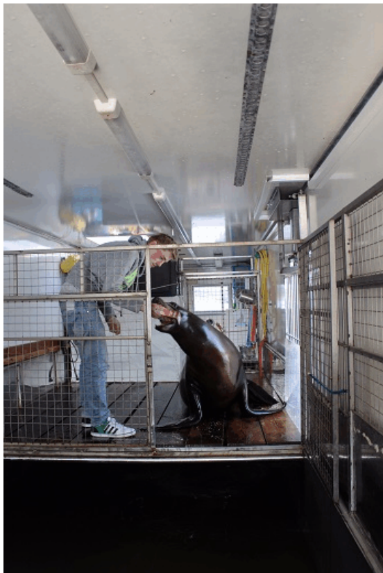
Transportwagen mit Seewasser-Becken

Während die Haltung von Robben im Süßwasser vielerorts üblich und auch möglich ist, können marine Zahnwalarten wegen etwaiger Hautprobleme, Hornhauttrübungen, dem notwendigen Osmosewert und der für das Ruhen und Schlafen notwendigen Dichte ausschließlich in entsprechend konzentriertem Seewasser gehalten werden (vgl. AMUNDIN 1986, ANDERSEN 1973 und GEWALT 1993).