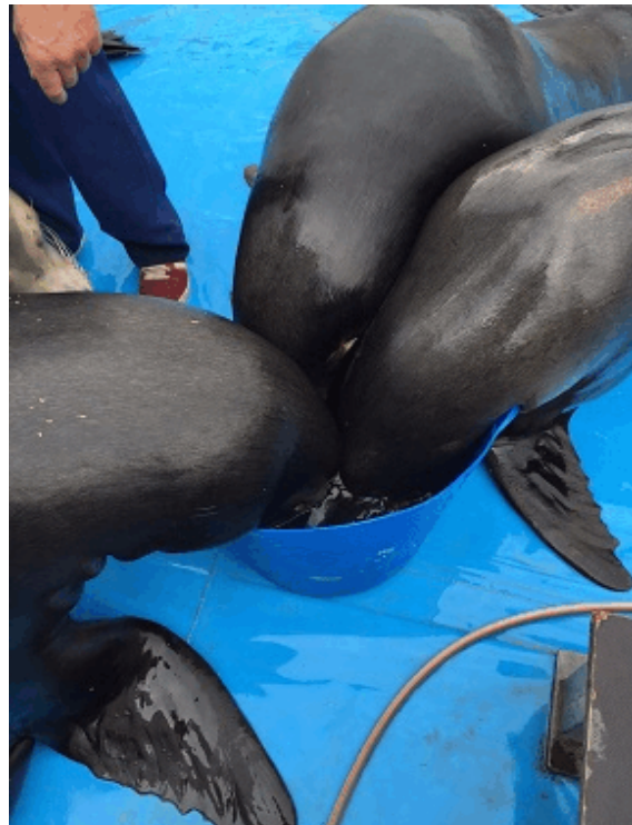
Seelöwen tauchen Köpfe in einen Kübel mit hoch konzentriertem Salzwasser

In Ergänzung hierzu erhalten die Seelöwen, im Zuge ihrer täglichen Ration von 6 bis 8 Kilogramm Fisch, zudem Salztabletten. Sporadisch werden darüber hinaus Salzwasserspülungen der Augen durchgeführt. Täglich findet dagegen wiederum das Eintauchen des Kopfes in einen Kübel mit sehr hoch konzentriertem Salzwasser statt, das die Tiere auf das Kommando „down“ vollführen.