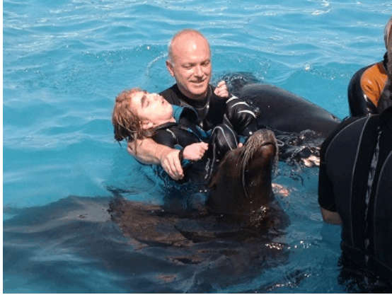
Schwimmangebote für Menschen mit Beeinträchtigungen

Hierzu gehört v. a. das Schwimmen mit den Seelöwen.