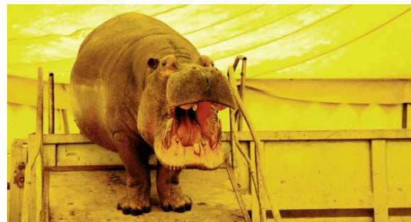
Jedi auf Rampe (Foto: Sascha Grodotzki / Circus Voyage)

Wir wollen in dieser Ausgabe noch einmal auf das erwähnte Bassin zurückkommen. Das heißt, wir möchten Ihnen ein paar Impressionen dazu nachliefern, damit Sie sich diese doch sehr besondere Konstruktion besser vorstellen können. Sascha Grodotzki hat hierzu eigens weiteres Bildmaterial angefertigt.