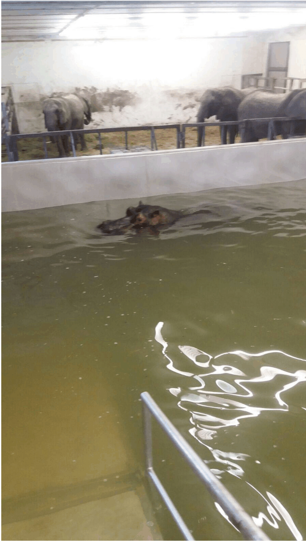
Jedi im Bassin