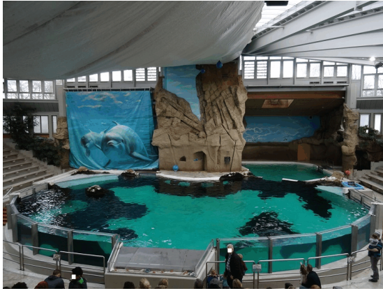
Delphinarium Zoo Duisburg: großzügiges Mehr-Becken-System mit Flachwasserzonen

Doch es gibt auch positive Parallelen zwischen Delphin- und Zirkustierhaltung. Der erste Delphintrainer ist der Seelöwen-Dompteur Adolf Frohn gewesen. Der einer Zirkusfamilie entstammende Frohn habe im April 1949 mit dem Training in den US-amerikanischen Marine Studios begonnen, das sich ganz am Wohl des Tieres orientiert habe. Und 1954 finden sich sogar erste Ansätze eines medizinischen Trainings (vgl. MCGINNIS & MESSINGER 2011).