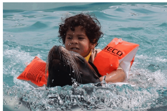
Ein Kind schwimmt mit einem Kalifornischen Seelöwen (Foto: Duss-Familie).

Das Außenbassin misst 12 m Länge, 7 m Breite und hat eine Höhe von 1,20 m. Eine Reinigung