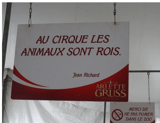
Andere kulturelle Settings, andere Sichtweisen

mit dem Thema Solidarität in Tierhaltungsfragen ist das so eine Sache.