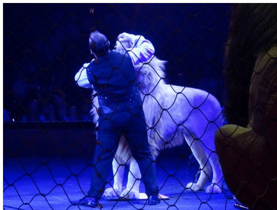
Nicht ungefährlich, aber ein Teil unseres Lebens und im Zirkus verantwortungsbewusst ermöglicht: die Nähe zur wilden Kreatur (Foto und Bildtext: Dennis Wilhelm)

Von einer Gefährdung der öffentlichen Sicherheit durch die Wildtierhaltung im Zirkus, wie sie als Grund für ein Verbot angeführt wird, kann keine Rede sein. Großwildtiere wie Elefanten, Nashörner oder Flusspferde, die von einem Wildtierverbot im Zirkus betroffen wären, sind mangels relevanter Vorkommnisse etwa in keinem einzigen deutschen Bundesland auf den Listen gefährlicher Tierarten geführt. Die Unfallzahlen durch Wildtierhaltung werden bei weitem dominiert durch die Reptilienhaltung in Privathaushalten. Unfälle mit Zirkustieren spielen praktisch keine Rolle. Die wenigen Einzelfälle, wie der unter noch ungeklärten Umständen aus einem Gehege entlaufene