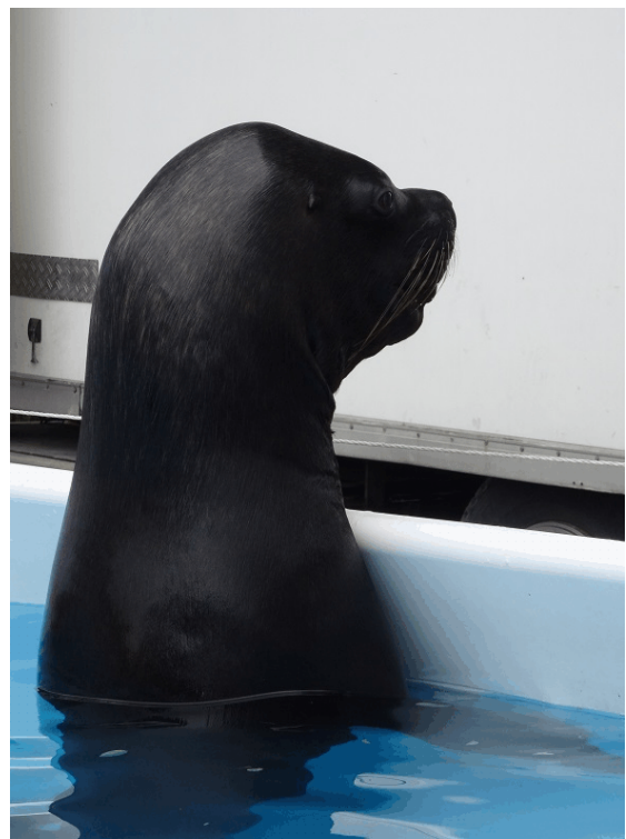
Geht es nach einigen EU-Abgeordneten, wird diese Nähe zwischen Mensch und Tier bald der Vergangenheit angehören (Foto und Bildtext: Dennis Wilhelm)

In Großbritannien hat sich bereits 2006 eine wissenschaftliche Kommission im Auftrag des nationalen Parlaments mit der Thematik beschäftigt und kommt zu einem übereinstimmenden Ergebnis: